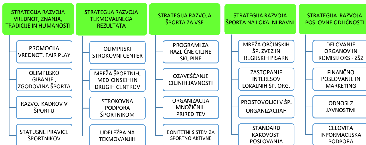
Prikaz 1: Dejavnosti združene v posamezno strateško poslovno področje.

Tako strukturirana strateška poslovna področja in ukrepi za posamezno strateško poslovno področje zapisani v strategiji, predstavljajo podlago za pripravo tako izvedbenih (Akcijski načrt Strategije OKS-ZŠZ 2014 – 2023) in operacionalizacijskih dokumentov (letni delovni in finančni načrt), kakor tudi organizacijskih aktov OKS-ZŠZ (Pravila OKS-ZŠZ in Pravilnik o organizaciji in sistemizaciji delovnih mest na OKS-ZŠZ).