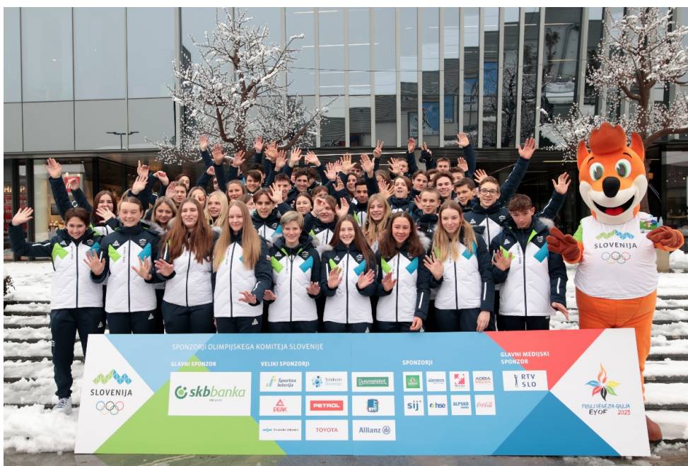
Zbor reprezentance Slovenije OFEM FJK 2023, SOIC

Po izobraževalnih vsebinah na uradni predstavitvi reprezentance smo opravili vse obveznosti, kot so fotografiranje reprezentance in prvi stik z mediji. Na zboru so bili prisotni skoraj vsi člani reprezentance, zato je bilo vzdušje res ekipno in olimpijsko. Člani odprave so bili s spoznavnim dnevom zadovoljni in predlagajo, da se praksa nadaljuje tudi v prihodnje, saj so bistvo iger prav olimpijske vrednote: prijateljstvo, spoštovanje in odličnost.