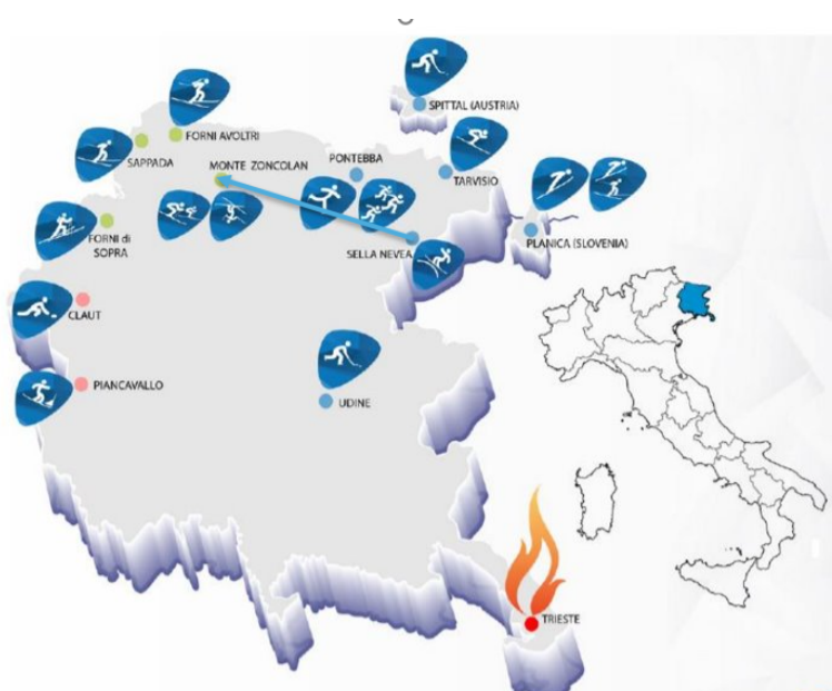
Razpršenost tekmovalnih prizorišč